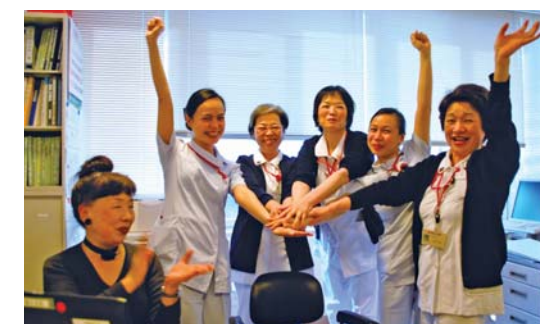
喜びを分かち合う看護師たち

3月25日に合格記者会見を行い、テレビ局4社、新聞社6社から取材を受けました。2人は終始笑顔を決やさず、喜びに溢れた会見となりました。