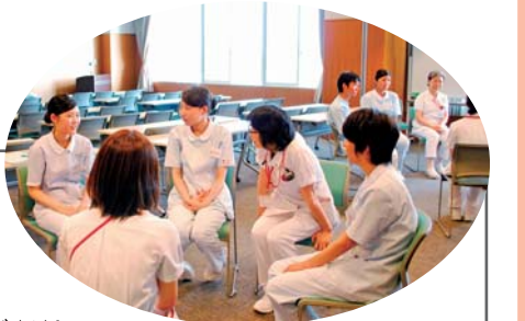
▲昨年のインターンシップ(先輩看護師との交流会)