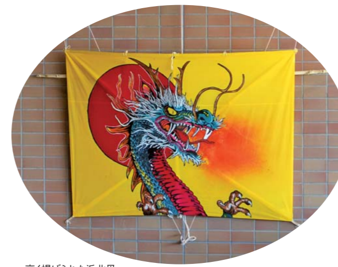
高く揚げられた浜北凧