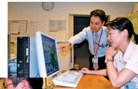
企画課電子カルテ係とシステム管理係のスタッフ

11月下旬には、病院新築時に整備し7年が経過した電子カルテシステムの更新を行い、院内にある300台以上のパソコンや再来受付機などが新しくなりました。