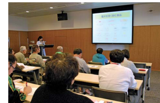
糖尿病教室の風景