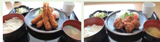
新メニューのエビフライ定食