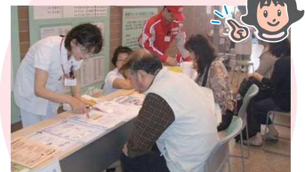
悩みや疑問にお答えする看護相談

日時 平成23年5月13日(金) 10:00~12:00 場所 浜松赤十字病院 1階 エントランスホール 内容 災害救護のパネル展示 血圧測定 看護相談 他