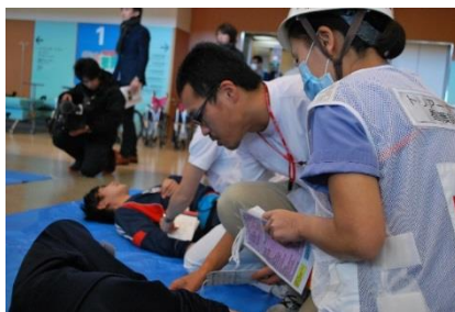
トリアージの様子

災害対策本部から指示を受けた職員は、傷病者受入れのためトリアージ(※)エリア・中等症エリア・重症エリアを設定し傷病者の受入を開始しました。