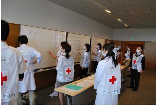
災害対策本部での情報収集

一連の流れを検証していくことで、新たな課題も見つかりました。今後とも万が一の事態に備え、定期的に訓練を実施していきます。