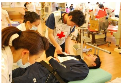
重症エリアで診察にあたる医療スタッフ

一連の流れを検証していくことで、新たな課題も見つかりました。今後とも万が一の事態に備え、定期的に訓練を実施していきます。