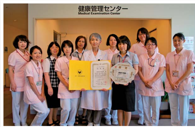
医師、保健師、事務職が集まり認定書ととも記念撮影